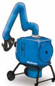
FilterBox 10 M Cenovno ugodna naprava, ročno čiščenje filtra za lahek in srednje lahek prah & aplikacije kjer se odsesuje dim