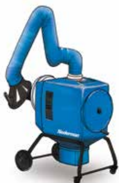
FilterBox 12 A Avtomatsko čiščenje filtra za težji prah & in aplikacije kjer se odsesuje dim

Internacionalne zdravstvene organizacije so prepoznale pomembnost po preprečevanju rizika povezanega z varlnim dimom med varjenjem. V veliko državah so že v veljavi standardi za zgornji limit izpostavljenosti nevarnemu dimu (PEL). Varilni dim tudi poškoduje stroje kot so roboti. Filterbox je tudi primeren za odsesovanje varilnega dima nerjavečih jekel (>30% vsebnost kroma) in izpolnjuje zahteve OSHA za krom (VI).