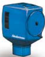
Stenski Filterbox Vsestranska naprava brez odsesovalne roke za povezavo na zunanji ventilator