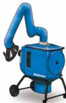
FilterBox 10 eQ Vrh ponudbe, ergonomska naprava za lahek in srednje lahek prah & aplikacije kjer se odsesuje dim