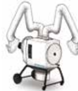
FilterBox Hygiene Twin