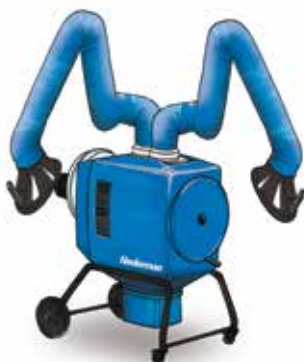
FilterBox Twin Ekonomsko ugodna rešitev za srednje težke aplikacije in dva delovna mesta