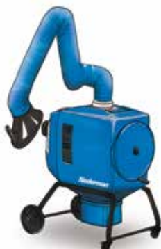
FilterBox 10 A Avtomatsko čiščenje filtra za lahek in srednje lahek prah & aplikacije kjer se odsesuje dim