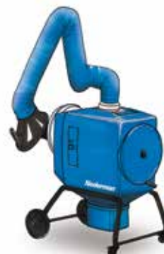
FilterBox 12 M Cenovno ugodna naprava, ročno čiščenje filtra z močnejšim ventilatorjem za težje aplikacije